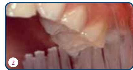
Als je de tanden in de lengterichting poetst, sla je de nieuwe blijvende kies die doorbreekt over (foto 1). Juist de nieuwe kiezen zijn extra kwetsbaar. Zet de tandenborstel daar dwars op de tandenrij (foto 2).

Als nieuwe kiezen doorkomen, zwelt vaak het tandvlees op. Dat is normaal. Het kan pijn doen, maar je hoeft niet ongerust te zijn.