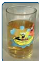
Ook appelsap is een zuur en suikerrijk tussendoortje

Behalve goed poetsen, napoetsen en controle door de tandarts of mondhygiënist, is het belangrijk dat je goed op de voeding van je kind let. Op en tussen de tanden en kiezen ontstaat tandplak: een nauwelijks zichtbaar, plakkerig wit-gelig laagje. De bacteriën in de tandplak zetten suikers (bijvoorbeeld uit snoep, koek, frisdrank en fruit) en zetmeel (bijvoorbeeld uit aardappels, pasta, brood of crackers) in de mond om in zuren. Die zuren veroorzaken gaatjes (cariës) in het gebit. Frisdrank, vruchten(sap) en bijvoorbeeld sportdrank bevatten behalve suikers ook zuren. Deze zuren kunnen het tandglazuur oplossen. Deze vorm van slijtage heet tanderosie. Beperk om gaatjes en tanderosie te voorkomen het aantal eet- en drinkmomenten tot maximaal 7 per dag: 3x een maaltijd en maximaal 4x per dag een tussendoortje. Stimuleer je kind kraanwater te drinken.