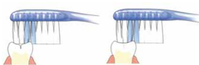
Tandenborstel komt niet in de groef

Kiezen hebben veel groefjes op het kauwvlak. Daarin ontstaat makkelijk tandplak. Niet regelmatig verwijderde tandplak kan gaatjes veroorzaken. Goed poetsen dus! Als de tandarts of mondhygiënist ziet dat er in het kauwvlak een gaatje ontstaat, kan hij besluiten een laagje aan te brengen. Dit heet sealen. Diepe groeven kan hij door het sealen afdichten. Alleen de blijvende kiezen komen normaal gesproken in aanmerking om te sealen. Dit gebeurt meestal kort nadat ze helemaal zijn doorgebroken. Ook gesealde kiezen moet je goed poetsen.